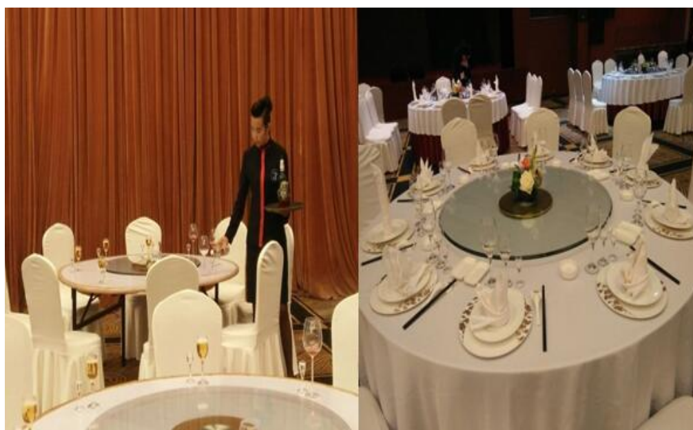
酒店职业技能大赛